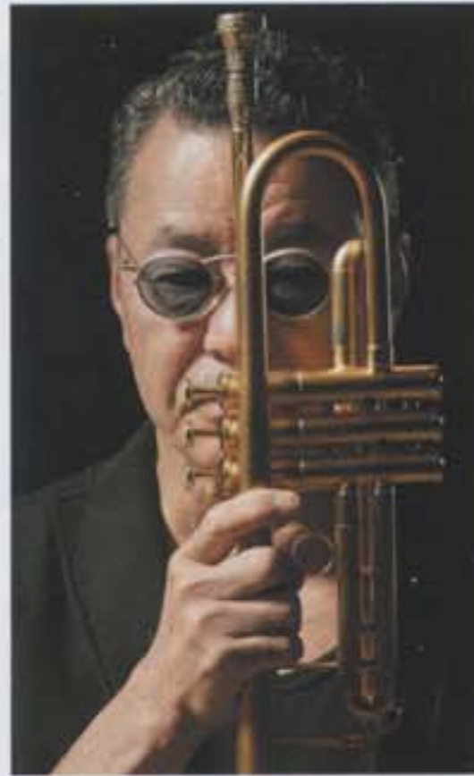
trumpet 日野 皓正

1942年10月25日東京生まれ。9歳よりトランペットをはじめ、13歳の頃には米軍キャンプのダンスバンドで活動を始める。1967年の初リーダーアルバムをリリース以降、マスコミに「ヒノテル・ブーム」と騒がれるほどの注目を集め、国内外のツアーやフェスティバルへの出演をはじめ、雑誌の表紙を飾るなどファッションブルなミュージシャンとして多方面で活躍。1975年、NYへ渡り居をかまえ、数多くのミュージシャンと活動を共にする。その後もヒットアルバムを連発、CM出演など多数。1989年にはジャズの名門レーベル「ブルーノート」と日本人初の契約アーティストとなる。90年以降、「アジアを一つに」という自身の夢のもと、アジア各国での活動を増やしていく。2001年芸術選奨「文部科学大臣賞」受賞。2004年紫綬褒章、文化庁芸術祭「レコード部門 優秀賞」、毎日映画コンクール「音楽賞」受賞。現在、dj honda、次男 日野JINO賢二を迎えたユニット「日野皓正 h factor」にてライブを行う他、同ユニットにてニューアルバム「Unity-h factor」を2013年6月に発売。また近年はチャリティー活動や後進の指導にも情熱を注ぎ、個展や画集の出版など絵画の分野でも活躍が著しい。唯一無二のオリジナリティと芸術性の高さを誇る日本を代表する国際的アーティストである。