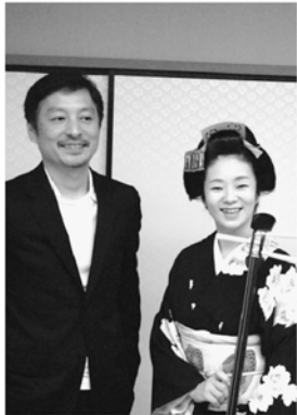
▶「婦人公論」で対談させて頂いた作家 島田雅彦氏と。