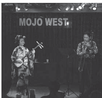
ライブ MOJO WESTにて

京都の方はもちろんのこと、各地から「うめ吉ファン」が駆けつけてくださいました。楽しい思い出をありがとうございます。