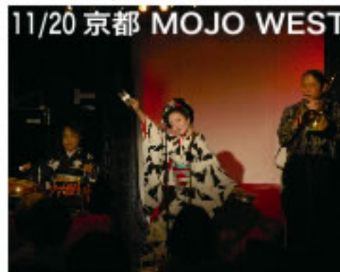
11/20 京都 MOJO WEST

昨年11月のうめ吉は、いっつも増し て大忙し。ライブに落語会で全国各 地を飛び回りました。さて、移動距 離はいかに？ スタートは京都から。昨年もライブ を行いましたMOJO WESTにて、今 回は久しぶりにトロンボーンのおミ ーさんと共演。京都お近くの方も遠 くからお越しの方も応援ありあとう ございました。