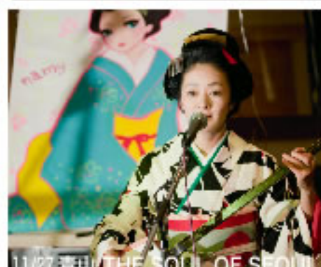
11/27 青山 THE SOUL OF SEOUL

寄席にライブに駆け抜けました 暮れ押しせまる11月の10日間！ みなさまありがとうございます。