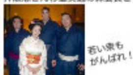
呑い衆もがんばれ!

毎年恒例になりました、元鷺羽山間が親の方々の「出羽の海部屋新年会」。倉敷の方々を含め、いろいろなジャンルの方々もお会いできるのがいつも楽しみです。