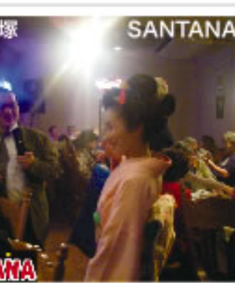
11/29 平塚 SANTANA