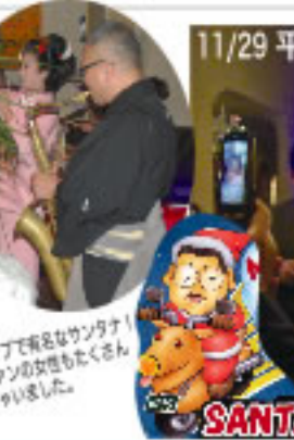
ジャズライブで有名なサンタナ！ 物販ファンの方もたくさん いらっしゃいました。

29日、神奈川県平塚市のレストラン 「サンタナ」にはうめ吉もびっくり するほどあふれんばかりのお客様。 初めての方もたくさんいらっしゃい ました。みなさま元気いっぱい、い うめ吉もパワーをいただき楽しさも 絶好調。懇親会のお料理も美味しく いただいた。次なる力になりました。 西に東に皆様とのふれあいの旅では 全てにお越しいただいた方もおられ ました。これからもみなさまとの出 会いを大切にして参ります。