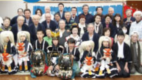
地元小学生による借中神楽