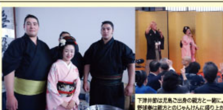
下津井節は兄島ご出身の親方と一緒に、 野球拳は親方とのじゃんけんに盛り上げ りました。