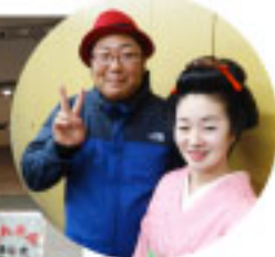
Wコロンの木曾さんちゆうさんと

今回のアルバムでうめ吉を知ったというお客様にもお話しいただき、長年のうめ吉ファンのみなさまと一緒に盛り上がりました。サイン会での交流もお楽しみいただきました。