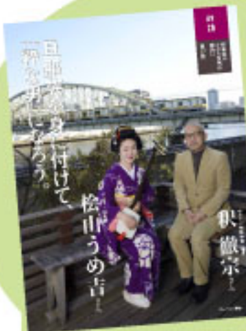
「Foley」5月号 対談(総ページ数5)