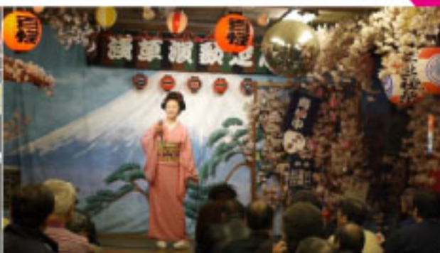
「あゝそれなのに」、「バイのバイのバイ」など、

テイチクエンターテイメントより 発売中! お座敷ロック／真赤な太陽／東京フギウギ／五月雨恋歌／月がとつても青いから／あゝそれなのに／トントン節／梅は咲いたか／銀座ロックン／三味線フギウギ／雲ロック／バイのバイのバイ／東京ドドンパ節／びっくりしゃっくりフギ／お座敷小唄／倉敷節(全16曲収録)