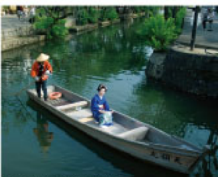
写真は以前撮影したものです

うめ吉 スケジュール ○5月4日(祝・日) ハートランド倉敷 倉敷物語館ライブ 出演:うめ吉 会場:倉敷物語館 時間:13時開演 (入場無料) 川舟流し 情報あふれる倉敷川。うめ吉も川舟にのってゆったりと。 時間:14時半より