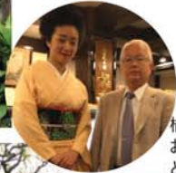
橘香堂の吉本社長。