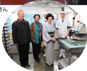
橘香堂の吉本社長。 お土産にはむらすずめをどうぞ。