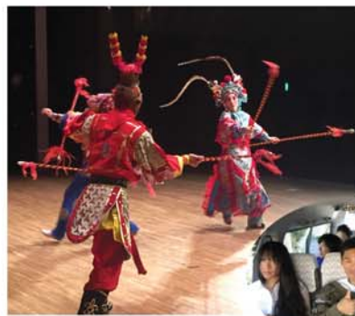
移動中の車内は旅回り一座の雰囲気いっぱい

2日間にわたり敬老会のアトラクションへ出演。共演には京劇や中国雑技あり、漫談あり、クラシックあり、漫談あり、というバラエティションでした。