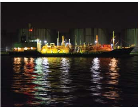
コンビナートの夜景もお楽しみに