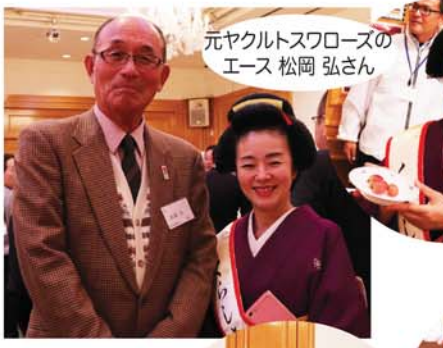
元ヤクルトスワローズのエース 松岡 弘さん