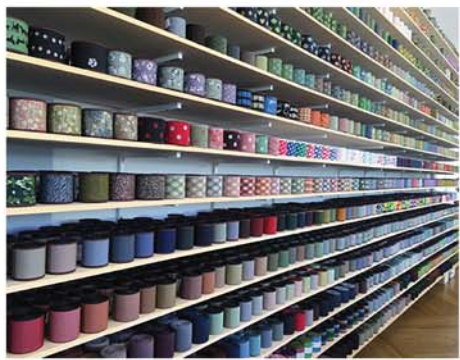
畳縁もこれだけあると圧巻。畳縁グッズも色々あります