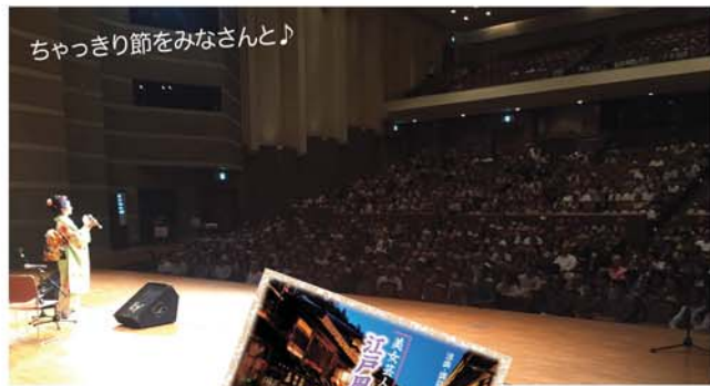
ちゃっきり節をみなさんと♪