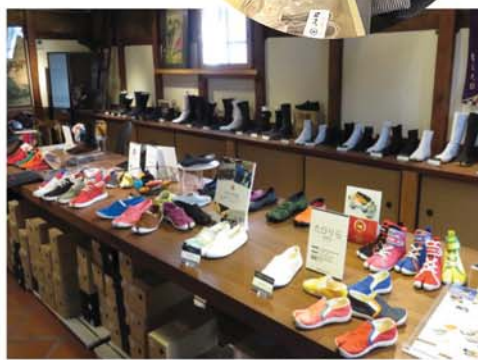
おしゃれな地下足袋がズラリ!