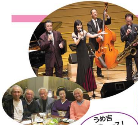
当企画にご尽力いただきましたヤマハOB会の皆様