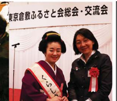
東京倉敷ふるさと会総会・交流会