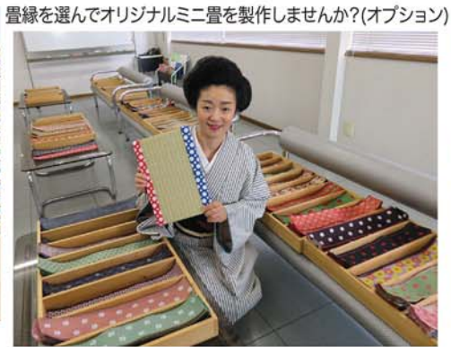
畳縁を選んでオリジナルミニ畳を製作しませんか?(オプション)