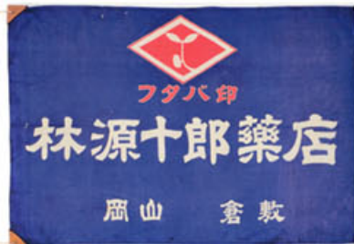
昭和初期に使用していた社旗