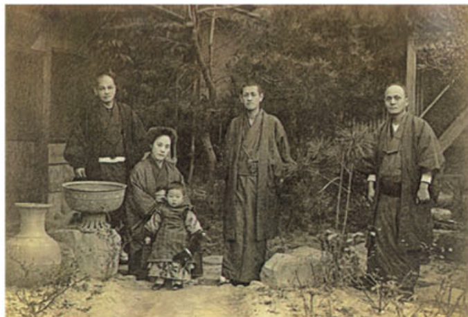
左から児童福祉の父と言われた石井十次、大原壽恵子(孫三郎夫人)と大原総一郎、大原孫三郎、十一代林源十郎