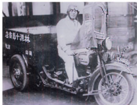
ハーレーダビッドソンの三輪車で営業活動