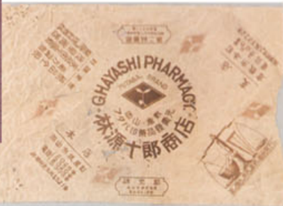
林源十郎商店で使用していた包装紙