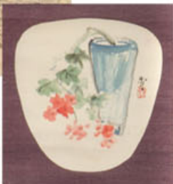
林源十郎商店が昭和初期にお得意先へ配布した団扇の原画(児島虎次郎画・大原美術館所蔵)